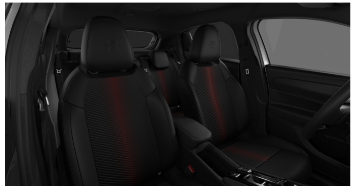
Преміальний комбінований салон, код 070