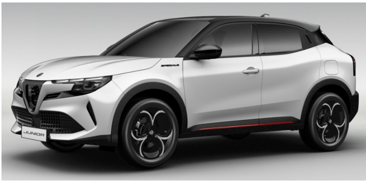
Забарвлення кузова фарбою металік білого кольору, код фарби 268 – BIANCO SEMPIONE