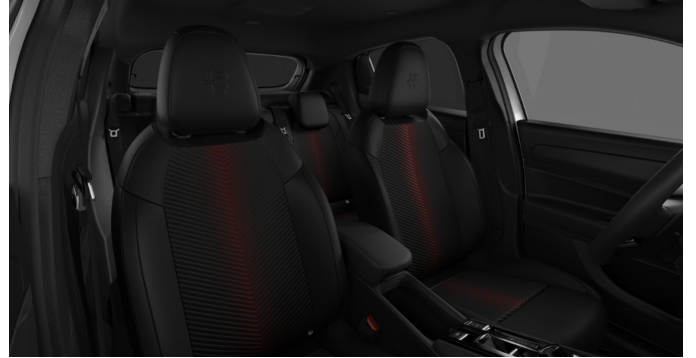
Преміальний комбінований салон, код 070