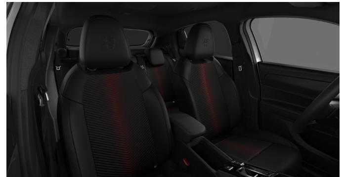
Преміальний комбінований салон, код 070