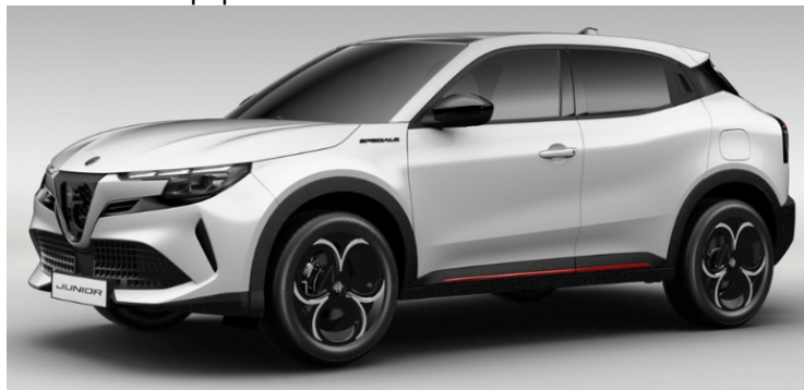
Забарвлення кузова фарбою металік білого кольору, код фарби 268 – BIANCO SEMPIONE